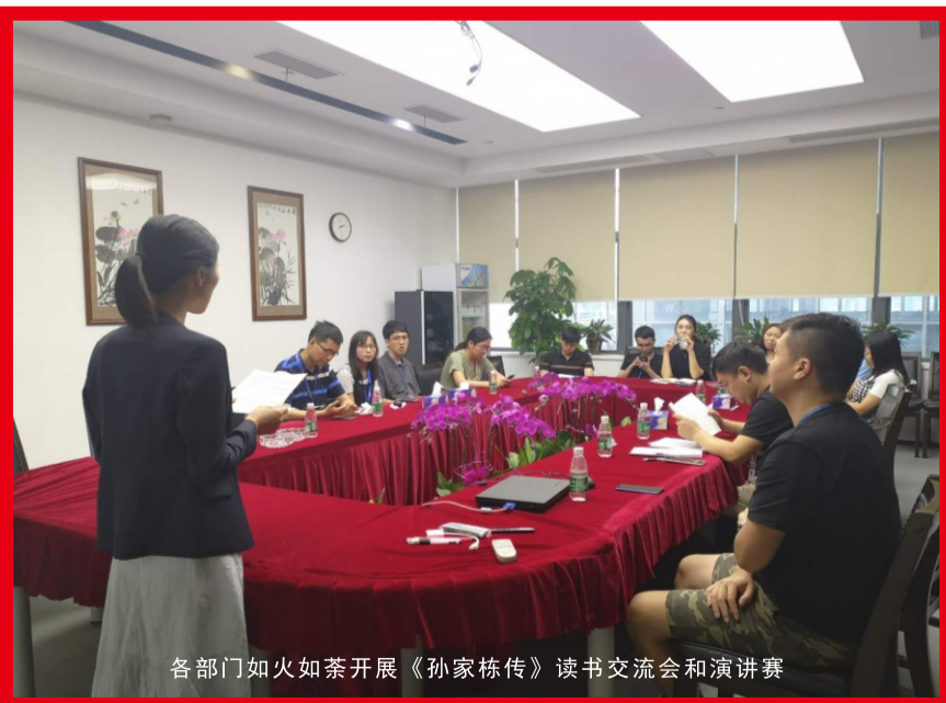
各部门如火如荼开展《孙家栋传》读书交流会和演讲赛

今年，我们每个人都制定了自己能力提升的目标。只要大家努力去实现，我们的队伍中就不会再有患得患失的自卑者，每一个海洋王人就能在追求能力提高的过程中建立必胜的信念，成为自信的人。