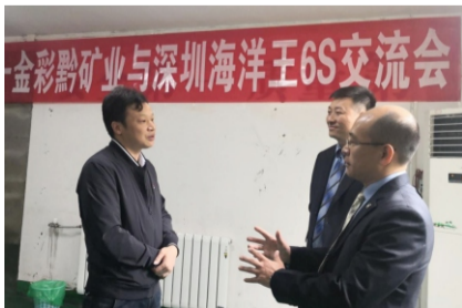
会后与客户单位领导深入交流