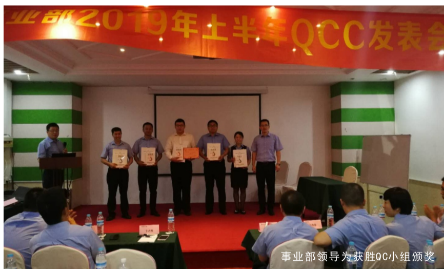
事业部领导为获胜QC小组颁奖