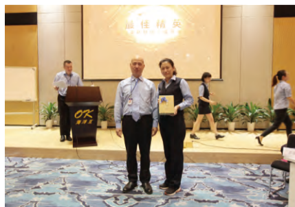
董事长为“最佳精英”颁奖