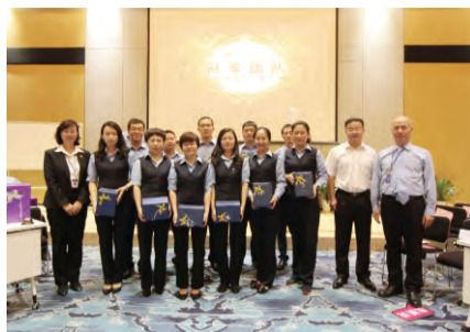
公司领导为“冠军团队”颁奖