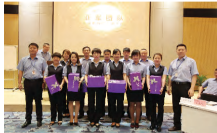
公司领导为“亚军团队”颁奖